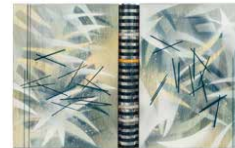
Einband von Susanne Natterer, 2013 Brigitte von Savigny (Hrsg.) „Schattenfuge“

Polykarbonateinband mit schwebendem Rücken, 182 x 225 mm