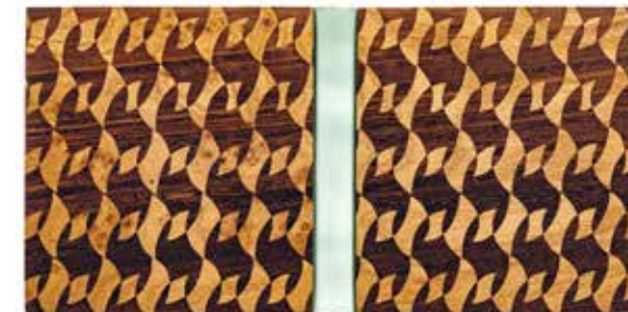
Einband von Astrid Zach, 2020 Jochen Missfeldt „Schleiland“

Bradelband mit Holzdeckeln, Dekor in Intarsien, Kopf-Goldschnitt, Handgestochenes Kapital, 155 x 155 mm