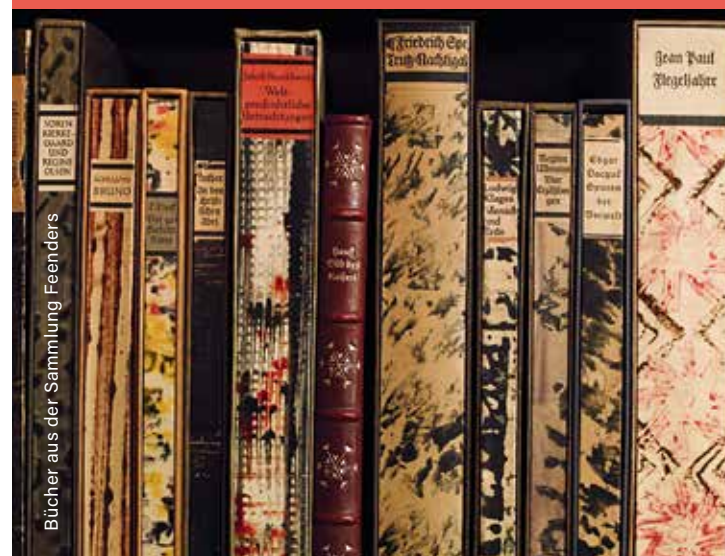
Bücher aus der Sammlung Feenders